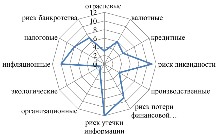
Рисунок 2 – Роза (звезда) рисков ООО «РН-Учет» 7

Согласно рисунку, метод розы рисков является интуитивным методом, который основывается на экспертных оценках и предназначен для более наглядной оценки и ранжирования рисков организации. Для построения розы рисков каждому виду риска была присвоена балльная оценка от 1 до 12 (чем выше балл, тем выше рискованность) в соответствии с их процентными значениями доли риска. Например, 12 баллов присвоено риску утечки информации, поскольку ему присвоена наибольшая доля – 15,4% (табл. 5). Исходя из сформированного единого ранжированного списка рисков по значимости, составлена спираль рисков ООО «РН-Учет» (рисунок 3).