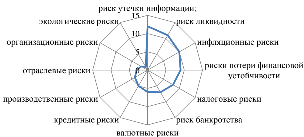
Рисунок 3– Спираль рисков ООО «РН-Учет» 8

Согласно рисунку, метод розы рисков является интуитивным методом, который основывается на экспертных оценках и предназначен для более наглядной оценки и ранжирования рисков организации. Для построения розы рисков каждому виду риска была присвоена балльная оценка от 1 до 12 (чем выше балл, тем выше рискованность) в соответствии с их процентными значениями доли риска. Например, 12 баллов присвоено риску утечки информации, поскольку ему присвоена наибольшая доля – 15,4% (табл. 5). Исходя из сформированного единого ранжированного списка рисков по значимости, составлена спираль рисков ООО «РН-Учет» (рисунок 3).